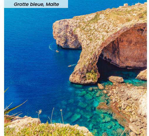
Grotte bleue, Malte

Retrouvez le programme détaillé de nos voyages dans votre agence ou sur notre site web !