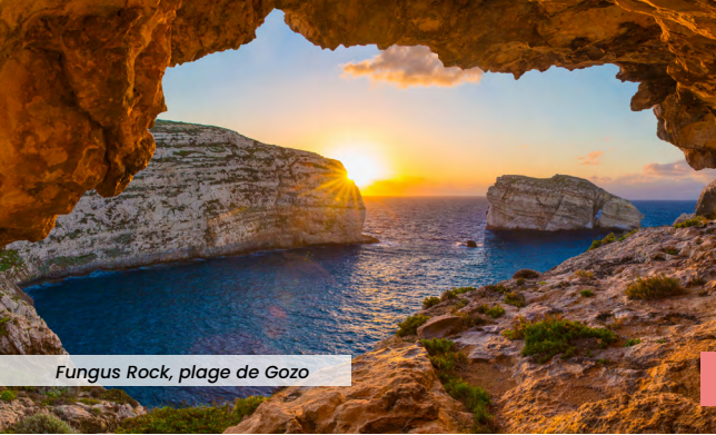
Fungus Rock, plage de Gozo